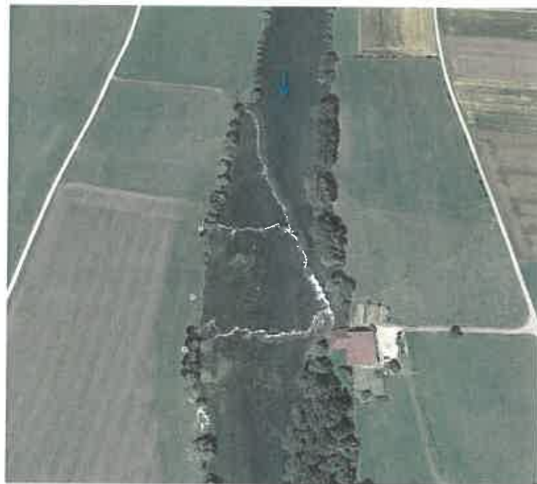
Vue aérienne du barrage du moulin de Brères

Dans le cadre des obligations de mise en conformité des ouvrages classés en liste 2, le représentant des propriétaires (Indivision) du moulin de Brères a été rencontré à plusieurs reprises dans la perspective de la réalisation par le Syndicat mixte de la Loue, d'une étude préliminaire pour la définition des aménagements à réaliser si nécessaires.